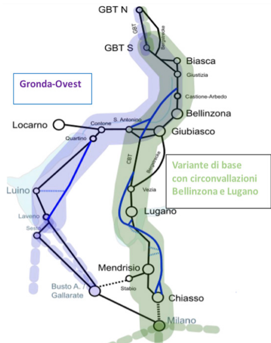
Completamento di AT con le varianti

Buona parte degli studi di fattibilità per il completamento di AT, compreso la tratta Lugano-Chiasso, sono stati realizzati e richiedono degli approfondimenti necessari per la progettazione di massima. Dal punto di vista logistico, la realizzazione a tappe sarebbe un atout per l'attuale linea e per il traffico corrente. Sul piano finanziario, le risorse assicurate di 6 miliardi annui dal fondo FIF sono impegnate fino al 2040 nelle opere di manutenzione e nei progetti di ampliamento previsti, e non basteranno. Per il completamento delle diverse tappe di AT a sud delle Alpi si prevedono costi attorno agli 8.7 mia (Variante base con circonvallazione Bellinzona e tratta Lugano-Chiasso) e attorno ai 4.5 mia per la Gronda Ovest (tunnel Quartino-Laveno, stima grezza con var. +/- 50%, parte svizzera, ca. 1.2 mia). Pur trattandosi di opere da realizzare a partire dal 2040, le risorse disponibili non saranno sufficienti. È pertanto essenziale pensare a modalità di finanziamento che, come alle origini dell'opera gottardiana, ricorrano a risorse cantonali e internazionali e, se del caso, dei privati.