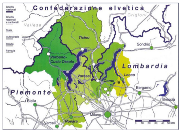
Regio insubrica / città dei laghi